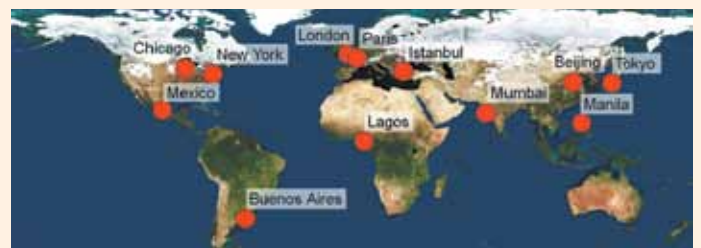
Table ronde sur les 12 Mégapoles

Synthèse des monographies , Blanca Elena Jiménez Cisneros, UNESCO PHI