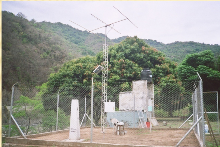
Estación remota Balapuca, río Bermejo