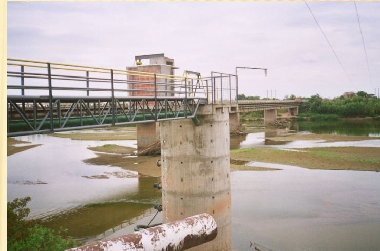
Sensor de nivel del agua, estación remota Embarcación, río Bermejo