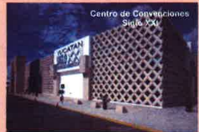
Centro de Convenciones Siglo XXI