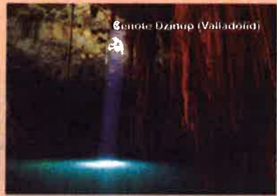
Cenote Dzucup (Valladolid)