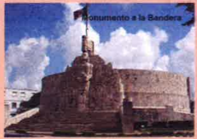
Monumento a la Bandera