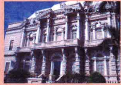
Palacio de Gobierno