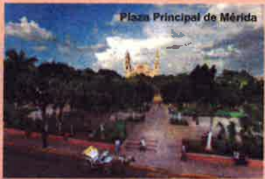
Plaza Principal de Mérida