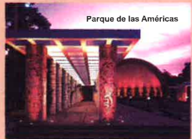
Parque de las Américas