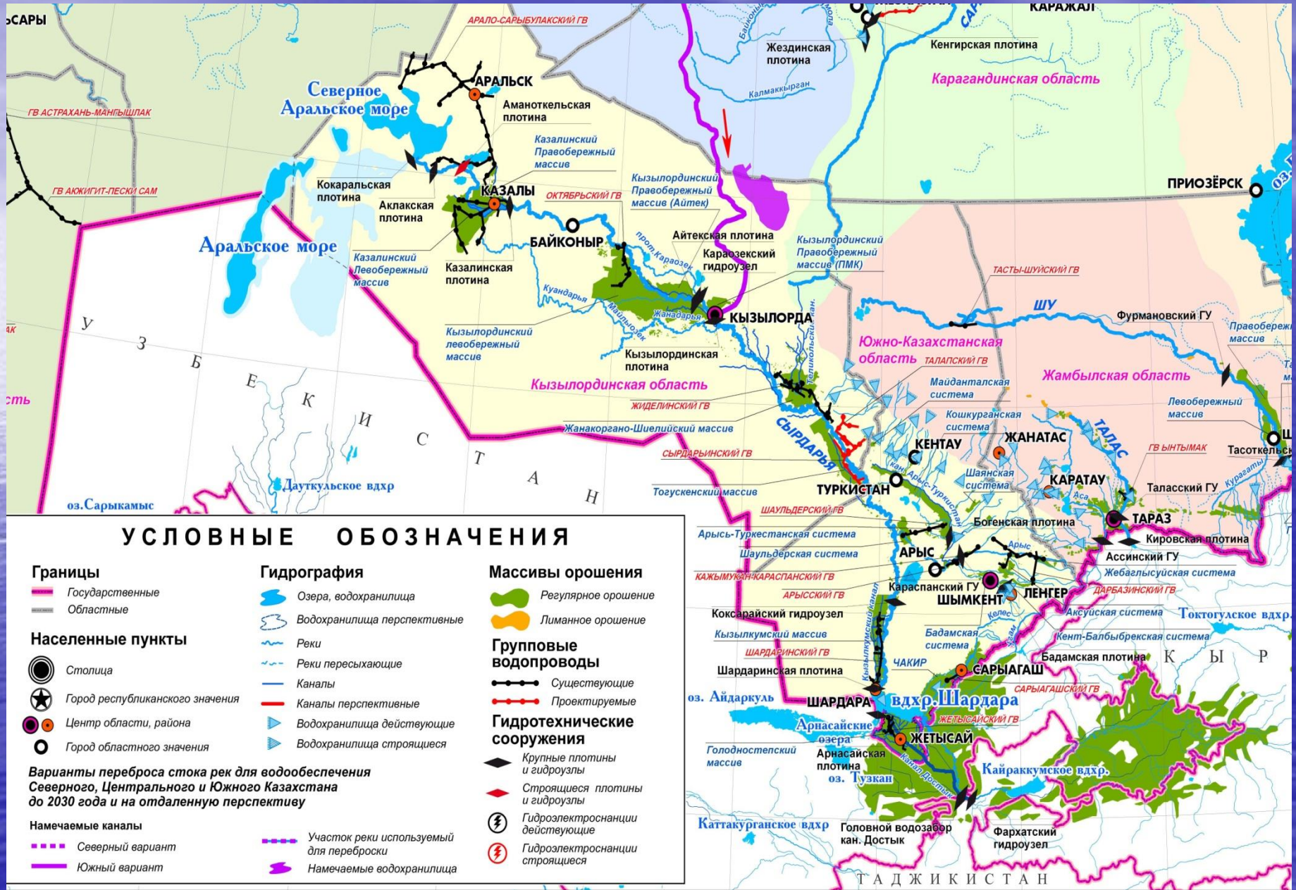
Схема бассейна реки Сырдарья